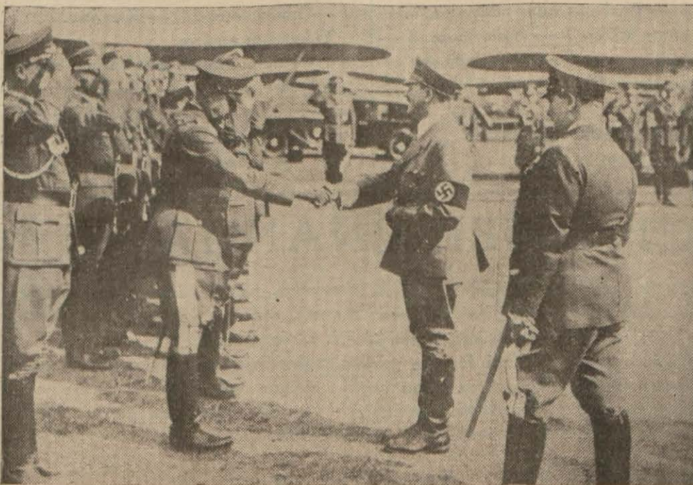
Hitler ve Göring bir Alman tayyare müfrezesini teftiş ederlerken

Lokarno devletleri hazırladıkları anlaşma projesini Almanyaya tebliğ ettiler. (Devamı 11 inci yüzde)