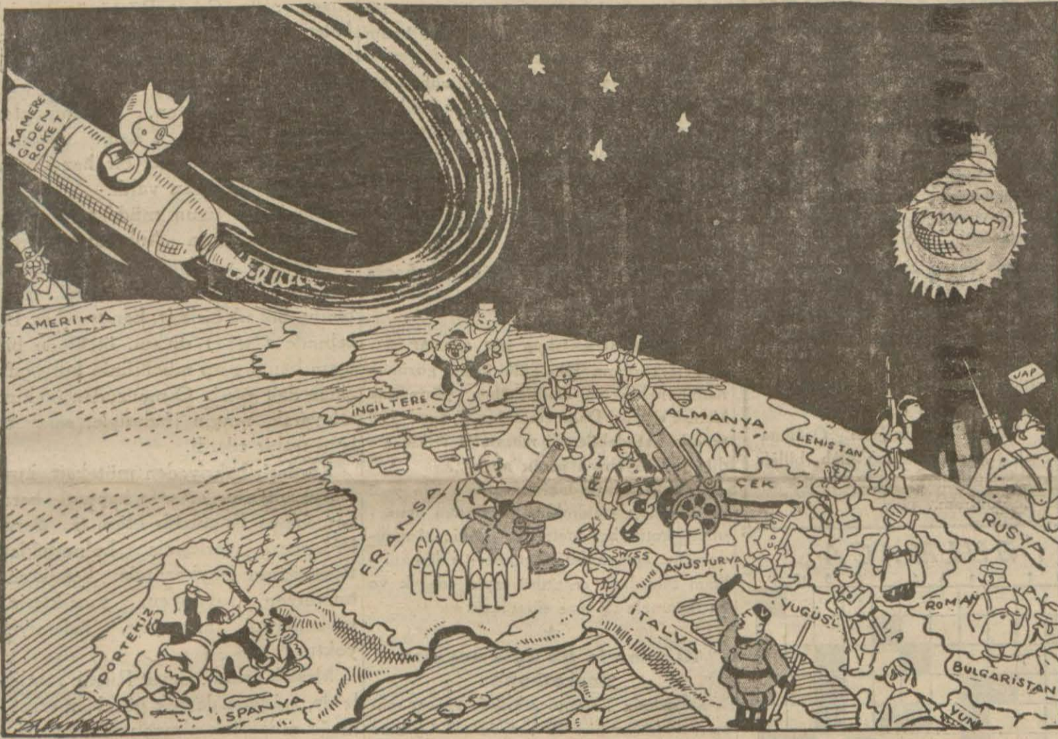
Gök yüzünden Avrupanın bugünkü görünüşü

Musolininin Lokarno devletleri projesine cevap vermemesi bu konuşmaların neticesini almak istemesine atfolunuyor